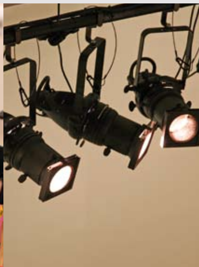
De VZW's en stichtingen