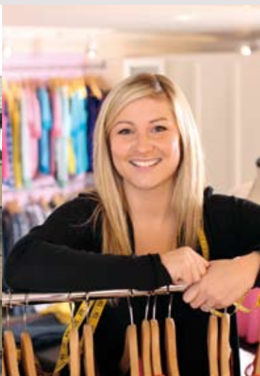
De zelfstandige ondernemer