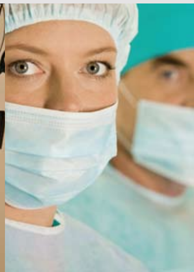
De vrije beroepen