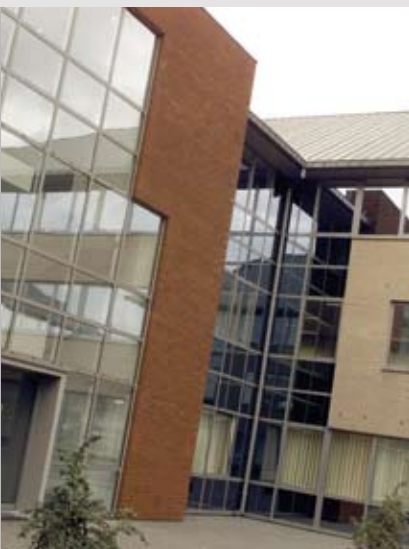
De KMO's en vennootschappen